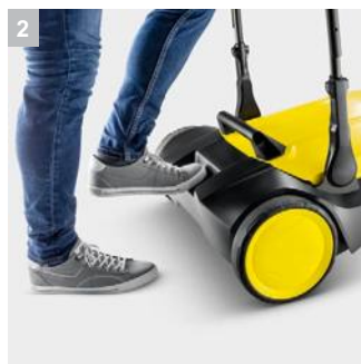
2 Удобное складывание машины