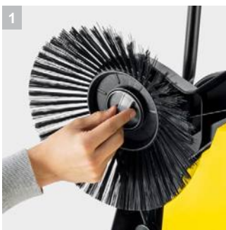
1 Практичный замок для боковой щетки

Идеально для больших и широких площадей и тщательной уборки до самого края, круглый год: подметальная машина S 6 Twin с 2 боковыми щетками, 38-литровым мусоросборником и шириной заметания 860 мм.