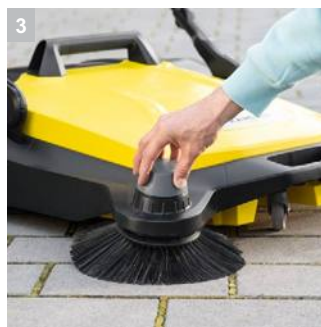
3 Регулировка высоты установки боковых щеток