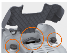
Casing with liftable cover Корпус с подъемной крышкой