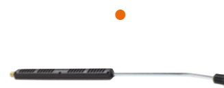
Bent lance with nozzle holder, without nozzle Угловая труба с насадкой для форсунки, без форсунки