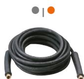
10 m rubber delivery hose kit Комплект резинового шланга подачи 10 м