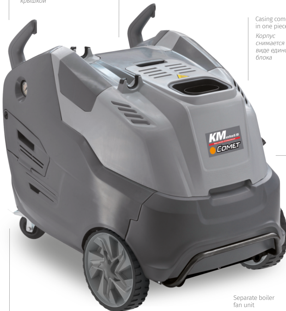
Casing comes off in one piece