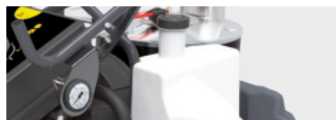
Ванночка для воды и цистерна для защиты от известковых отложений