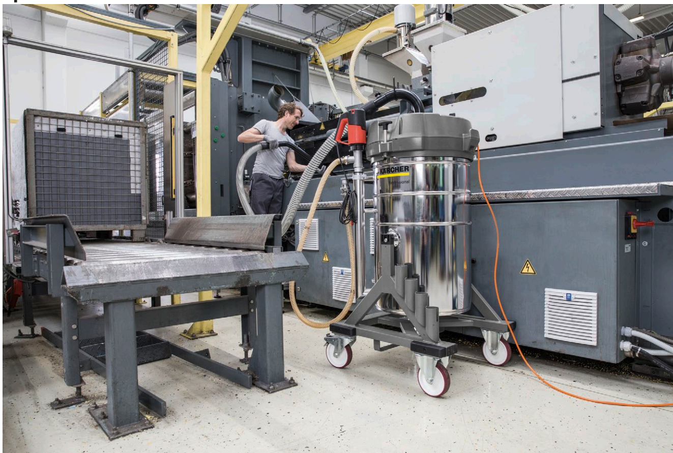
IVR-L 100/24-2 Tc Me Dp